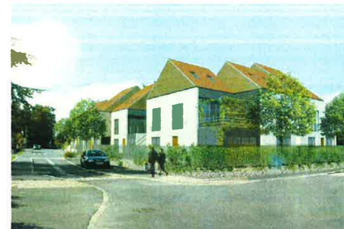
Illustration et documents non contractuels

Bâtiment Basse Consommation(1) Label EFFINERGIE