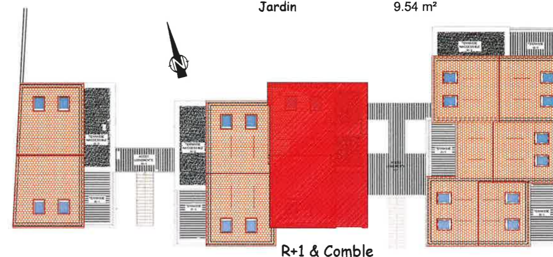
R+1 & Comble